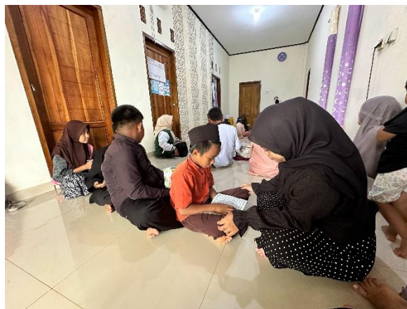
Gamabar 2.kesiapan santri dalam pengenalan surat surat pendek