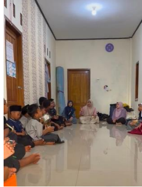
Gambar 1. proses pendampingan pengenalan surat surat pendek

pengenalan lebih luas tentang surat surat tersebut, seperti nama surat dan arti surat yang telah di bacakan dan jumlah surat ayat tersebut. Setelah memperkenalkan lebih luas tentang surat-surat maka guru memberikan kesempatan kepada santri untuk berdiskusi terkait materi yang telah disampaikan.