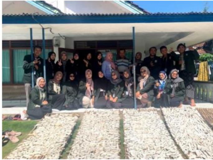
Gambar 1. Edukasi Pemasaran Online Kripik Ibu Faise