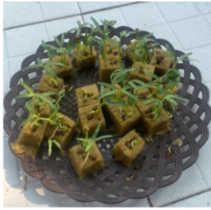
Gambar 3 Rockwool Yang Telah Disemai Dengan Bibit