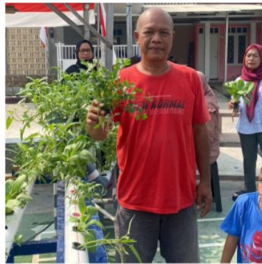
Gambar 4 Panen Warga

Setelah melalui masa panen, maka warga bisa mulai melakukan pembibitan ulang untuk tanaman sayuran pada periode berikutnya.