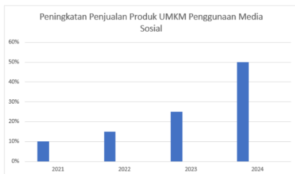
Gambar 2. Peningkatan Penjualan Produk UMKM Setelah Penggunaan Media Sosial

Penggunaan media sosial dalam pengembangan UMKM memiliki banyak keuntungan, 12 yang merupakan salah satu faktor pendorong yang kuat bagi UMKM untuk terus menggunakannya untuk mengembangkan usahanya, meningkatkan penjualan produk, berkomunikasi dengan pelanggan, dan memperluas jaringan pasar mereka.