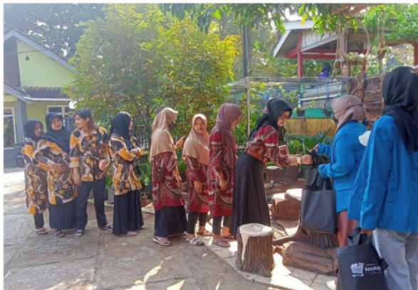
Gambar 1. Peserta pengabdian melakukan presensi dan siap mengikuti kegiatan

dan disisipkan bagaimana pengembangan membuka peluang usaha berjualan takoyaki. Pelatihan pembuatan takoyaki ini meliputi dari bahan-bahan yang dibutuhkan, alat masak, proses memasak, dan proses penyajian.