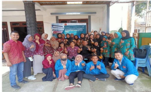
Gambar 5. pengambilan gambar tim pengabdian bersama peserta

Setelah melakukan praktek pelatihan, maka para peserta juga diberikan tester takoyaki agar tau bagaimana cita rasa takoyaki. Takoyaki yang menjadi tester adalah takoyaki yang di masak di tempat agar peserta bisa konsultasi langsung bagaimana proses saat memasak apakah ada kendala atau tidak. Interaksi ini sangat intens dan harmonis karena ibu-ibu PKK dari dulu berkeinginan membuat takoyaki tetapi ada rasa ketakutan saat mencoba. Mereka selama ini melihat video melalui youtube tetapi hanya sekedar menonton saja. Sehingga saat pelatihan ini akhirnya ibu-ibu PKK bisa tahu sendiri bagaimana memberanikan diri menjalankan praktek memasak takoyaki.