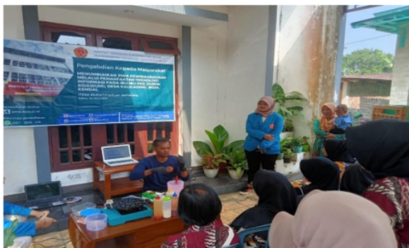
Gambar 2. Narasumber mempraktekan pembuatan takoyaki

Topping yang digunakan saat pengabdian masyarakat menggunakan keju, rumput laut, bakso, sosis, dan udang. Topping nantinya akan dimasukkan saat memasak takoyaknya. Setelah takoyaki sudah matang, maka nantinya akan disajikan dengan memberikan taburan katsuobushi dan diberikan saos dan mayonaise dan di plating dengan cantik agar menarik. Untuk pengembangan usaha, maka nantinya takoyaki bisa dikemas semenarik mungkin dengan menggunakan sterofoam atau kemasan plastik.