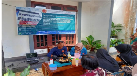
Gambar 3. Narasumber mengajarkan tehnik memasak dan penyajian

Setelah melakukan praktek pelatihan, maka para peserta juga diberikan tester takoyaki agar tau bagaimana cita rasa takoyaki. Takoyaki yang menjadi tester adalah takoyaki yang di masak di tempat agar peserta bisa konsultasi langsung bagaimana proses saat memasak apakah ada kendala atau tidak. Interaksi ini sangat intens dan harmonis karena ibu-ibu PKK dari dulu berkeinginan membuat takoyaki tetapi ada rasa ketakutan saat mencoba. Mereka selama ini melihat video melalui youtube tetapi hanya sekedar menonton saja. Sehingga saat pelatihan ini akhirnya ibu-ibu PKK bisa tahu sendiri bagaimana memberanikan diri menjalankan praktek memasak takoyaki.