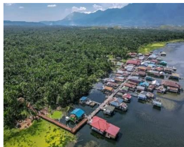
Gambar 4.3 Kondisi Lokasi Penelitian Kampung yoboi

Berdasarkan data WHO pada tahun 2017, Indonesia merupakan negara ketiga didunia yang memiliki sanitasi terburuk atau tidak layak dan perilaku BABS diIndonesia masuk dalam urutan kedua didunia (Damahinta, 2018). Dimana 20% dari populasi penduduk Indonesia sebanyak 54 juta masyarakat masih melakukan perilaku BABS (Kementerian RI, 2018).