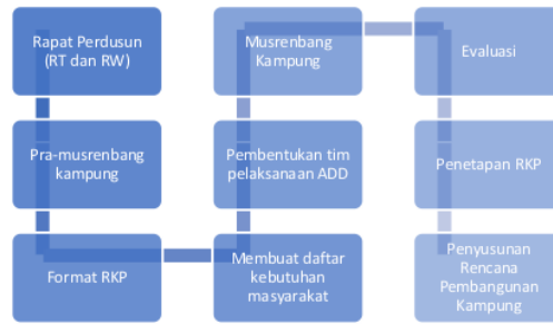
Gambar 1. Alur Perencanaan Penggunaan ADD

Hal ini dapat dilihat dari hasil musrenbang kampung mengenai data APBK di Kampung Skouw Mabo pada tahun 2023, yaitu: