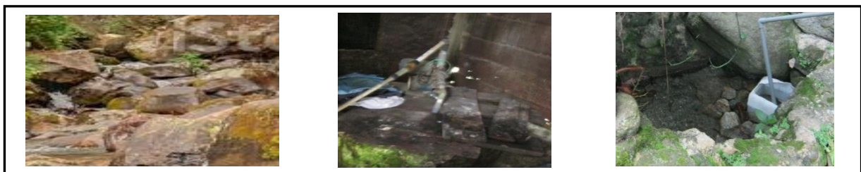
Gambar 1. sampel S.01 (mata air) Gambar 2. sampel D.02 (sumurgali) Gambar 3. sampel I.03 (mata air)