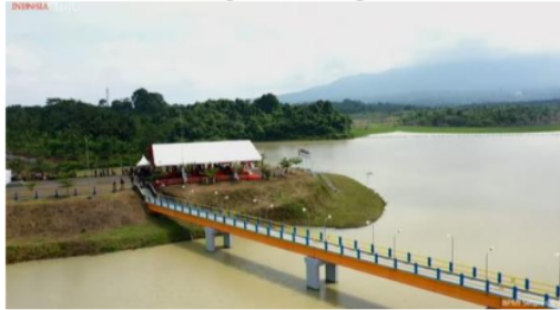
Gambar 1. Bendungan Sindang Heula