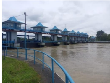
Gambar 3. Bendungan Pamarayan

Meskipun Bendungan Pamarayan terutama berfungsi untuk irigasi dan pengendalian banjir, potensi untuk pengembangan mikro hidro dapat dipertimbangkan. Namun, evaluasi lebih lanjut diperlukan untuk menentukan apakah debit aliran dan ketinggian jatuh air mencukupi untuk menghasilkan energi yang signifikan. Sebelum melakukan pengembangan energi terbarukan berbasis mikro hidro di Bendungan Pamarayan, diperlukan studi kelayakan yang mendalam untuk menilai potensi teknis, ekonomi, dan lingkungan. Berdasarkan data dari pemerintah daerah dan Kementerian Pekerjaan Umum dan Perumahan Rakyat (PUPR), debit aliran di Bendungan Pamarayan bervariasi tergantung musim. Debit rata-rata sekitar 5-10 m 3 /s pada musim kemarau dan bisa mencapai 30 m 3 /s pada musim hujan.