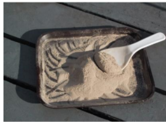
Gambar 1. Fly Ash Powder

dipergunakan dan dapat menambah daya tahan dan ketahanan terhadap bahan kimia. Perkembangan penggunaan penggantian portland cement dengan prosentase volume Fly ash yang tinggi (50%) pada perencanaan campuran beton, bahkan untuk "Roller Compacted Concrete Dam" penggantian tersebut mencapai 70 % telah dicapai dengan Pozzocrete (Fly ash yang diproses) pada "The Ghatghar Dam Project" di Maharashtra India. Fly ash juga dapat meningkatkan workability dari semen dengan berkurangnya pemakaian air. Produksi semen dunia pada tahun 2010 diperkirakan mencapai 2 milyar ton, di mana penggantian dengan Fly ash dapat mengurangi emisi gas carbon secara dramatis (Hendriks C. A. et al., 1999). Fly ash merupakan material yang memiliki ukuran butiran yang halus, berwarna keabu-abuan dan diperoleh dari hasil pembakaran batu bara.